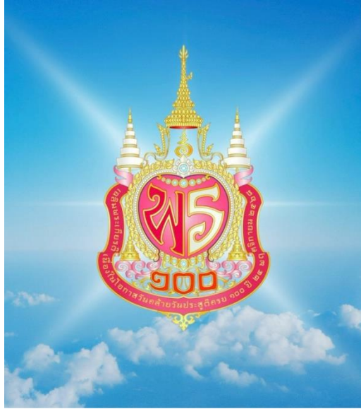
ภาพที่ 1 ตราสัญลักษณ์งานเฉลิมพระเกียรติสมเด็จพระเจ้าภคินีเธอ เจ้าฟ้าเพชรรัตนราชสุดา สิริโสภาพัณณวดี

เนื่องในโอกาสวันคล้ายวันวันประสูติครบ 100 ปี ของสมเด็จพระเจ้าภคินีเธอ เจ้าฟ้าเพชรรัตนราชสุดา สิริโสภาพัณณวดี ในวันจันทร์ที่ 24 พฤศจิกายน 2568 นั้น คณะกรรมการอำนวยการจัดงานเฉลิมพระเกียรติเห็นชอบให้มีการจัดทำตราสัญลักษณ์เนื่องในงานเฉลิมพระเกียรติดังกล่าว โดยมีนายปัญญาโพธิ์มี เป็นผู้ออกแบบ ซึ่งพระบาทสมเด็จพระวชิรเกล้าเจ้าอยู่หัว ทรงพระกรุณาโปรดเกล้าฯ พระราชทานพระบรมราชานุญาตให้ใช้ตราสัญลักษณ์เนื่องในงานเฉลิมพระเกียรติเนื่องในโอกาสวันคล้ายวันประสูติครบ 100 ปี ดังกล่าว