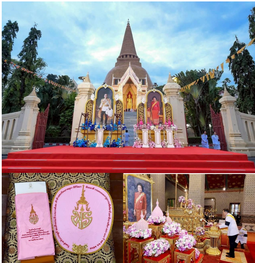
ภาพที่ 6-8 งานเฉลิมพระเกียรติสมเด็จพระเจ้าภคินีเธอ เจ้าฟ้าเพชรรัตนราชสุดา สิริโสภาพัณณวดี เนื่องในโอกาสวันคล้ายวันประสูติครบ 100 ปี 24 พฤศจิกายน 2568

จากรายละเอียดเกี่ยวกับตราสัญลักษณ์งานเฉลิมพระเกียรติข้างต้น ได้แสดงให้เห็นถึงการรวมตราสัญลักษณ์ที่มีความหมายอันเกี่ยวเนื่องด้วยพระบารมี และสะท้อนภูมิปัญญาของผู้สร้างสรรค์ตราสัญลักษณ์ที่ได้เลือกสรรเครื่องประกอบพระอิสริยยศ ตลอดจนสรรพสิ่งที่เป็นมงคลต่างๆ ที่เคยมีมาแต่โบราณราชประเพณีมาใช้เป็นสื่อ เพื่อสะท้อนถึงคติความเชื่อเกี่ยวกับสมเด็จพระเจ้าภคินีเธอ เจ้าฟ้าเพชรรัตนราชสุดา สิริโสภาพัณณวดี ได้อย่างเป็นรูปธรรมและสง่างามยิ่ง