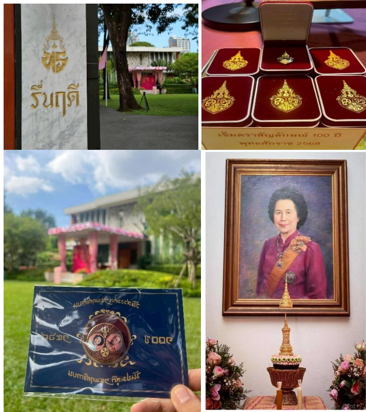
ภาพที่ 9-14 งานเฉลิมพระเกียรติสมเด็จพระเจ้าภคินีเธอ เจ้าฟ้าเพชรรัตนราชสุดา สิริโสภาพัณณวดี เนื่องในโอกาสวันคล้ายวันประสูติครบ 100 ปี 24 พฤศจิกายน 2568