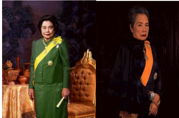
ภาพที่ 3-5 พระบรมสาทิสลักษณ์ พระสาทิสลักษณ์ และพระฉายาลักษณ์ พระบาทสมเด็จพระมงกุฎเกล้าเจ้าอยู่หัวและสมเด็จพระเจ้าภคินีเธอ เจ้าฟ้าเพชรรัตนราชสุดา สิริโสภาพัณณวดี