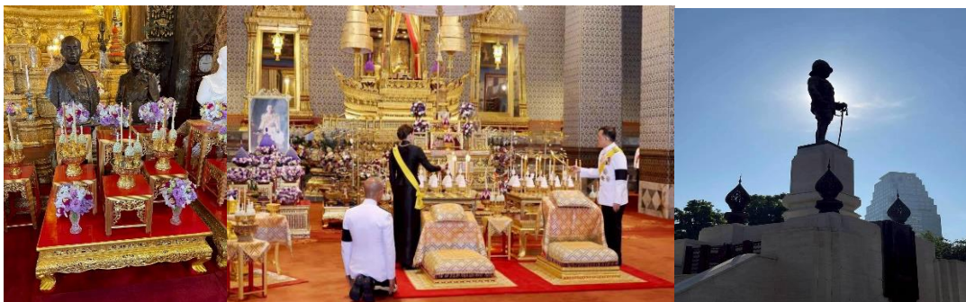
ภาพที่ 6-8 งานเฉลิมพระเกียรติพระบาทสมเด็จพระมงกุฎเกล้าเจ้าอยู่หัวเนื่องในโอกาสวันสวรรคตครบ 100 ปี 25 พฤศจิกายน 2568

ซึ่งกำหนดการหลักที่จัดงานในห้วงเดือนพฤศจิกายน 2568 ที่ผ่านมา คือการประดิษฐานพระบรมฉายาลักษณ์รัชกาลที่ 6 และพระรูปสมเด็จพระเจ้าภคินีเธอฯ เพื่อให้ประชาชนถวายสักการะ จัดกิจกรรมจิตอาสาบำเพ็ญสาธารณประโยชน์ทั่วประเทศ พิธีเจริญพระพุทธมนต์ และตักบาตรพระสงฆ์ 100 รูป ณ วัดพระปฐมเจดีย์ จ.นครปฐม โดยมีนายกรัฐมนตรีเป็นประธาน จัดพิธี ณ สถานที่ประดิษฐานพระบรมราชานุสาวรีย์รัชกาลที่ 6 และศาลากลางจังหวัด มีงานมหกรรมเฉลิมพระเกียรติ ณ สวนลุมพินี กรุงเทพฯ กิจกรรมแสง สี เสียง น้ำพุดนตรีนาฏศิลป์ร่วมสมัย นิทรรศการสวนแสง และสินค้าจาก 50 เขต ทั่วกรุงเทพฯ มีพิธีศววรรษมหาธีรราชานุสรณ์ เป็นพิธีถวายพวงมาลาที่โรงเรียนอนุบาลสระบุรี และการจัดนิทรรศการ “พระผู้มาก่อนกาล” จัดที่พิพิธสถาน อาคารศิลปวัฒนธรรม จุฬาลงกรณ์มหาวิทยาลัย ที่จัดถึงราวๆต้นเดือนมกราคม 2569 ซึ่งกลุ่มงานข้างต้นเป็นส่วนหนึ่งของการจัดงานเฉลิมพระเกียรติ 3 รัชกาล ซึ่งรวมถึงรัชกาลที่ 9 และรัชกาลที่ 10 รวมถึงการจัดทำหนังสือจดหมายเหตุและหนังสือที่ระลึกเพื่อเก็บรวบรวมไว้เป็นหลักฐานสำคัญทางประวัติศาสตร์ของชาติโดยสำนักหอจดหมายเหตุแห่งชาติ กรมศิลปากร กระทรวงวัฒนธรรม อีก ด้วย