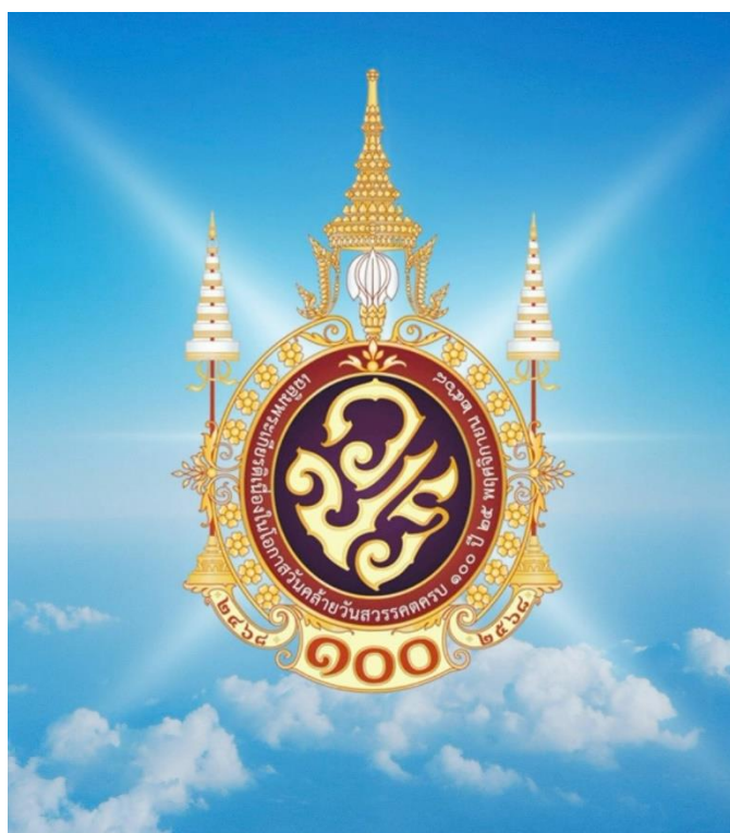
ภาพที่ 1 ตราสัญลักษณ์งานเฉลิมพระเกียรติพระบาทสมเด็จพระมงกุฎเกล้าเจ้าอยู่หัวเนื่องในโอกาสวันคล้ายวันสวรรคตครบ 100 ปี 25 พฤศจิกายน 2568

ในช่วงประมาณเดือนสิงหาคม 2565 มีการจัดงานเฉลิมฉลองและออกแบบตราสัญลักษณ์พระราชพิธีมหามงคลเฉลิมพระชนมพรรษา 90 พรรษา 12 สิงหาคม 2565 ปี 2566 มีการจัดงานเฉลิมฉลอง 100 ปีวันประสูติของสมเด็จพระเจ้าพี่นางเธอ เจ้าฟ้ากัลยาณิวัฒนา กรมหลวงนราธิวาสราชนครินทร์ (คงไว้ซึ่งพระนามเดิมตามชื่องาน) และช่วงต้นปี 2568 มีการจัดงานเฉลิมพระเกียรติพระบาทสมเด็จพระเจ้าอยู่หัวในการพระราชพิธีสมมงกุฎพระชนมายุ 26,469 วัน เท้าพระบาทสมเด็จพระพุทธยอดฟ้าจุฬาโลกมหาราช สมเด็จพระปฐมบรมมหาชนกแห่งพระราชวงศ์จักรี พุทธศักราช 2568 วันที่ 14 มกราคม 2568 และในช่วงประมาณเดือนกันยายน 2568 ในรัชกาลปัจจุบัน รัฐบาลโดยสำนักนายกรัฐมนตรีได้ดำเนินการให้มีการประดับตราสัญลักษณ์เนื่องในโอกาสวาระครบรอบศตวรรษแห่งวันพระบรมราชสมภพ “ศตวรรษมหาธีรราชานุสรณ์” ร่วมกับการจัดงานวันลูกเสือแห่งชาติ พระบาทสมเด็จพระปรเมนทรมหาอานันทมหิดล พระอัฐมรามาธิบดินทร รัชกาลที่ 8 ในวันที่ 20 กันยายน 2568 ซึ่งโดยภาพรวมแล้วองค์ประกอบที่สำคัญของตราสัญลักษณ์จะแสดงด้วยภาพหรือพระราชสัญลักษณ์หรือรูปสัญลักษณ์หรือพระปรมาภิไธยย่อที่มีความเกี่ยวข้องกับโอกาสสำคัญในเดือนมหามงคล หรือการเฉลิมฉลองให้ปรากฏรวมในตราสัญลักษณ์นั้นเป็นประการสำคัญ