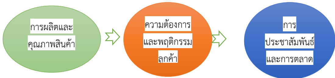
แผนภาพที่ 2 องค์ความรู้ใหม่จากการวิจัย

จากการศึกษาการยกระดับคุณภาพสินค้าผ้าขาวม้าทอมือและการบริการของกลุ่มวิสาหกิจชุมชนผู้สูงอายุบ้านหลวงศิริ ตำบลหนองบัวแดง อำเภอหนองบัวแดง จังหวัดชัยภูมิ พบองค์ความรู้ที่สามารถสรุปเป็นแผนภาพได้ดังนี้ (แผนภาพที่ 2)