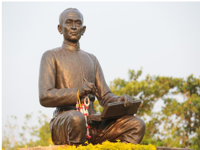
สุนทรภู่