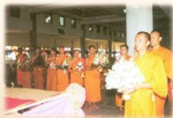
ตัวแทนพระนิสิตทุกคณะชั้นปีที่ 1-4 นำพานพุ่มดอกไม้ที่ช่วยกันทำมา เพื่อเข้า ถวายสักการะผู้บริหารและคณาจารย์