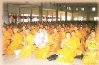
พระนิสิตกล่าวทักท้วงและคำบูชา พระคุณครูต่อผู้บริหาร คณาจารย์

กล่าวถวายรายงานต่อ พระธรรมวราชนายก ประธานในพิธีไหว้ครูประจำปี 2547