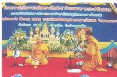
พระศรีธรรมภรณ์