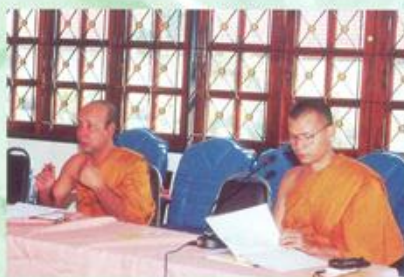
พระสมจิต พุทธิวิริโย

กล่าวรายงานต่อ พระเทพสีมาภรณ์ ประธานสภาวิทยาเขตนครราชสีมา ถึงการจัดโครงการปฏิบัติธรรมเฉลิมพระเกียรติ 5 ธันวาคมทศวรรษ และการปฏิบัติธรรมประจำปีของพระนิสิต ชั้นปีที่ 1 - 4 ของมหาวิทยาลัยมหาจุฬาลงกรณราชวิทยาลัย วิทยาเขตนครราชสีมา ระหว่างวันที่ 26 พฤศจิกายน - 6 ธันวาคม 2544