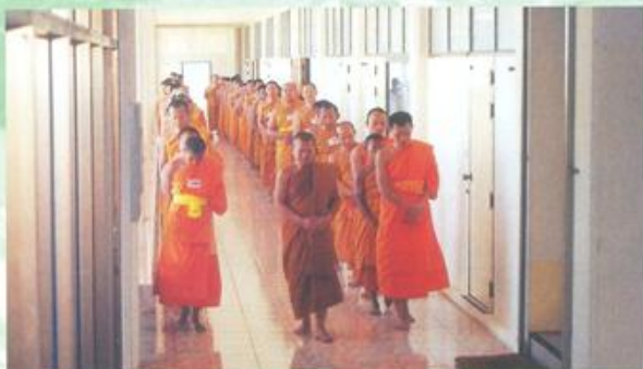
กิจกรรมประจำวัน คือ สวดมนต์เช้า-เย็น นั่งสมาธิ เดินจงกรม