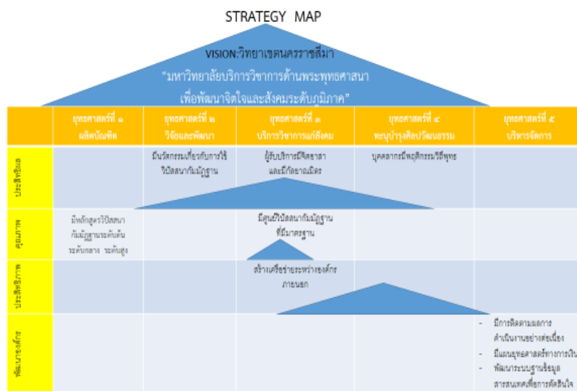
ภาพที่ ๑ แผนที่กลยุทธ์ของวิทยาเขตนครราชสีมา ช่วงแผนพัฒนาการศึกษาระดับอุดมศึกษา ระยะที่ ๑๒

ผลจากการปรับปรุงแผนพัฒนาวิทยาเขตนครราชสีมาเมื่อวันที่ ๙-๑๐ กรกฎาคม ๒๕๖๒ สรุปรูปแผนพัฒนาวิทยาเขตนครราชสีมา มี ๕ ยุทธศาสตร์ ๙ วัตถุประสงค์เชิงกลยุทธ์ ๑๐ โครงการ มี รายละเอียดดังนี้